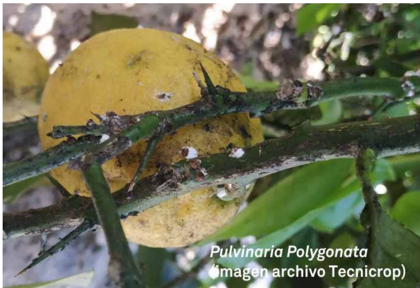
Pulvinaria Polygonata

Hay que prestar especial atención a que no todos los productos comerciales de/con una misma materia pueden estar autorizados para un mismo cultivo, plaga, uso o tener diferente fecha de caducidad. Por ello se debe consultar detenidamente la etiqueta del producto y el Registro fitosanitario de los productos fitosanitarios.